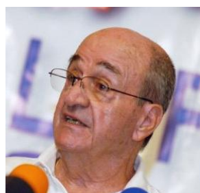
Jean-Marie Tjibaou et Jacques Lafleur, les frères ennemis de la Nouvelle-Calédonie

Celui de 2021 a formellement été réclamé au gouvernement français par les deux groupes indépendantistes siégeant au Congrès. Ils demandaient que le droit de vote soit restreint aux citoyens français résidant de longue date et de manière continue. Sur les trois listes électorales déterminées, l'une est consacrée spécialement au référendum de 2021 portant sur l'accession éventuelle de la Nouvelle-Calédonie à la pleine souveraineté, à savoir le transfert à celle-ci de compétences régaliennes, l'accès à un statut international de pleine responsabilité et l'organisation de la citoyenneté en nationalité.