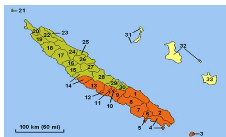
Les 33 communes ; remarquer que la 14 est partagée entre le Nord et le Sud

Les trois Provinces sont des collectivités territoriales de la République qui se gèrent librement par des assemblées élues au suffrage universel. La réunion des représentants de ces trois Provinces (Nord, 15 membres ; Sud, 32 membres ; Îles Loyauté, 7 membres) forme le Congrès du Territoire. Matignon prévoyait un référendum « pour ou contre l'indépendance ». Mais les indépendantistes, les non-indépendantistes et l'État négocient une solution consensuelle. Un référendum constitutionnalise et ratifie cet accord (voté par 72% des Calédoniens). Il est alors décidé, par l'accord de Nouméa (1998), d'organiser un référendum sur l'accession à la pleine souveraineté.