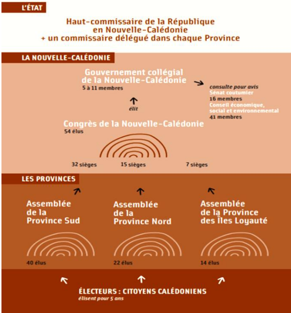
Le système électoral de la Nouvelle-Calédonie

Pour ce qu'il en est du référendum de 2021, en raison de l'abstention prescrite d'une manière subtile par les chefs kanak, invoquant la crise de la Covid et redoutant surtout le vote nouveau s'opposant à l'indépendance, le Non l'a emporté à 96,50% des suffrages exprimés (pour l'indépendance : 3,50%). On note d'ailleurs une forte baisse de la participation par rapport au référendum précédent (votes : 43,87%). Ce référendum de 2021 marque la fin de la période définie par l'accord de Nouméa, à laquelle doit succéder une transition permettant de définir un nouveau statut pour l'archipel au sein de la République française, le texte devant être lui-même soumis à référendum dans le courant de 2023.