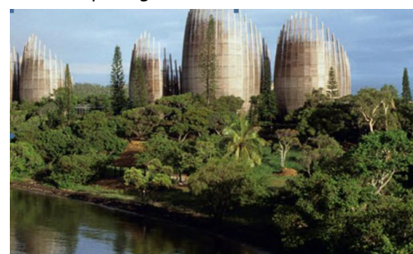
Le centre culturel Jean-Marie Tjibaou

Le référendum du 12 décembre 2021 sur l'indépendance de la Nouvelle-Calédonie porte donc sur l'autodétermination. Il s'agit du dernier des trois référendums prévus dans l'accord de Nouméa de 1998, après celui de 2018 (soldé par une victoire du Non à 56%) et celui de 2020 (victoire du Non à 53%). Un référendum avait bien été organisé dès 1987, mais fut boudé par la communauté kanak.