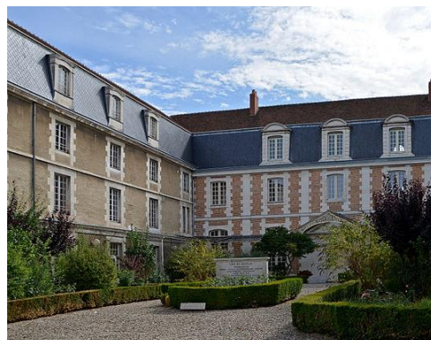
Le lycée Jacques Amyot d'Auxerre, autrefois collège des Bénédictins, où enseigna Fourier dès l'âge de 16 ans

Je pense cependant avoir saisi que Fourier avait côtoyé certains des esprits les plus éclairés de son siècle (Monge, Arago, Champollion...) et que son influence fut décisive dans de nombreux et divers domaines : économie du département de l'Isère, enseignement... Il fut, en son temps, un précurseur, avec déjà des préoccupations écologiques, ainsi qu'une volonté de faire évoluer le statut des femmes (il encourage Sophie Germain à présenter à l'Institut ses travaux en mathématiques).