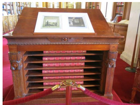
La Description de l'Égypte (1809), œuvre monumentale en 22 tomes dont Fourier rédigea la préface

La conférence de Dominique fut l'occasion de revoir avec plaisir des amis, anciens membres du Club, et d'autres, futurs membres peut-être ? Quant au contexte de son intervention, il présentait toutes les composantes habituelles d'une petite classe : les élèves bavards et dissipés dans le fond, les élèves besogneux (ceux dont les appréciations sont invariablement : « Peut mieux faire ! », voire : « Peut mieux faire avec plus d'efforts », dont moi-même !) au milieu, et enfin les sérieux, proches de la chaire du maître !