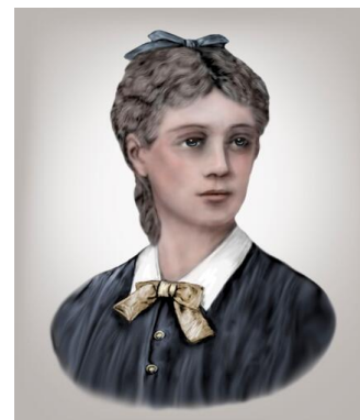
Sophie Germain (1776-1831)