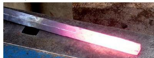
Propagation de la chaleur le long d'une barre

L'équation de la chaleur pour une barre met en relation l'évolution de la température en un point avec sa variation le long de la barre en faisant intervenir ces deux constantes. En effet, la température varie avec le temps d'autant plus vite que la conductivité thermique est élevée, par contre une capacité calorifique plus importante ralentit sa variation, chaque point de la barre absorbant davantage de chaleur avant de la transmettre au point voisin.